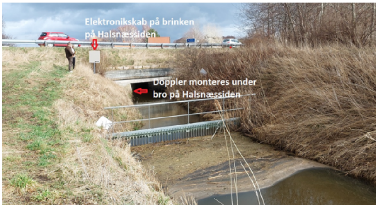
Figur 2. Placering af doppler under broen og elektronikkasse på brinken. Billedet er taget på opstrøms side af broen hvor rute 16 krydser vandløbet

Miljøstyrelsen har den 3. maj 2023 ansøgt om opsætning af en ny vandføringsmålestation under landevejsbroen på rute 16 henover Lyngby Å. Stationen indgår i Det Nationale Overvågningsprogram for Vandmiljø og Natur (NOVANA) mht. stoftransport. Her følger uddrag af ansøgningen.